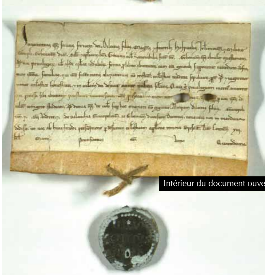
Intérieur du document ouvert

Pour une fois nous vous proposons de remonter le temps, pour vous présenter ce qui semble être la première mention des chevaliers de Saint-Jean de Jérusalem dans la région genevoise.