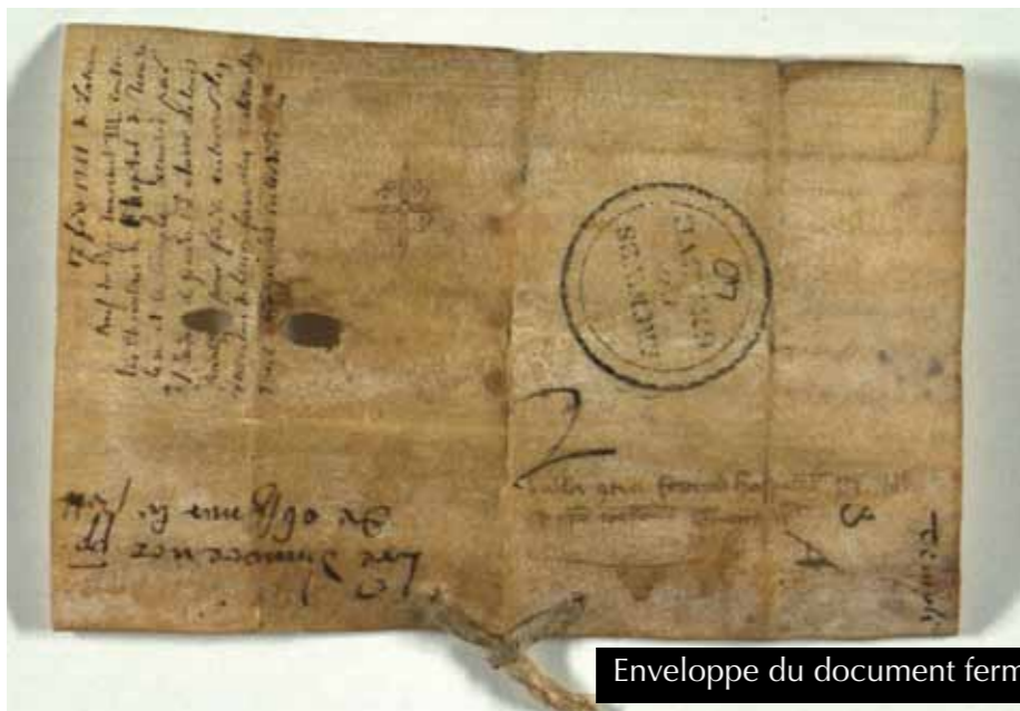
Enveloppe du document fermé

La Mémoire de Bardonnex a pour mission première de récolter aujourd'hui ce qui fera la mémoire de demain.